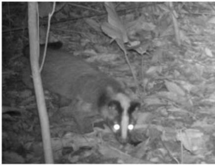
A 花面狸 Paguma larvata