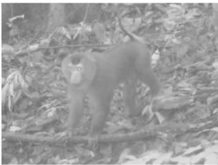
C 北豚尾猴 Macaca leonina