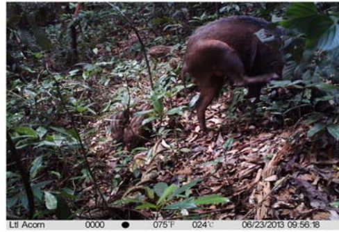
B 野猪 Sus scrofa