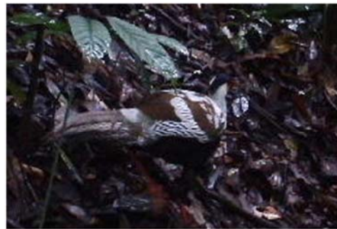
D 白鹇 Lophura nycthemera