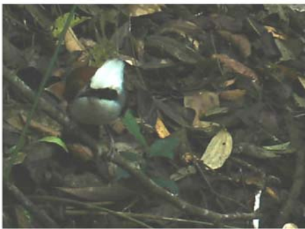
E 白冠噪鹛 Garrulax leucolophus