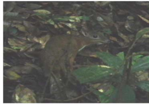
F 威氏小麂鹿 Tragulus williamsoni